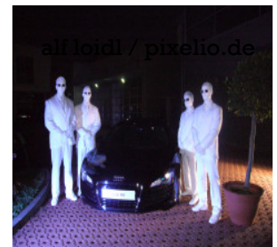
Das Electric Dance Theatre bei der Präsentation eines Fahrzeugs.

„Die Kunst ist es Menschen zu verzaubern“